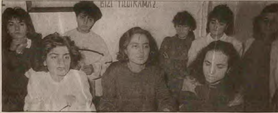
Endüstri işçisiyle, hemşiresiyle kadınlar, militan kavgayı yükseltiyor, ilettiliyorlar.

1985'de kabul edilen TKP Programı'nda, kadın sorununun nasıl çözüleceği gösterilmekte ve atılacak adımlardan biri olarak pozitif ayrımcılığa da yer verilmektedir. Kadın sorununa ve pozitif ayrımcılığa tutarlı bir yaklaşımı göstermesi açısından programımızın konuyla ilgili bölümünü yayınlıyoruz: