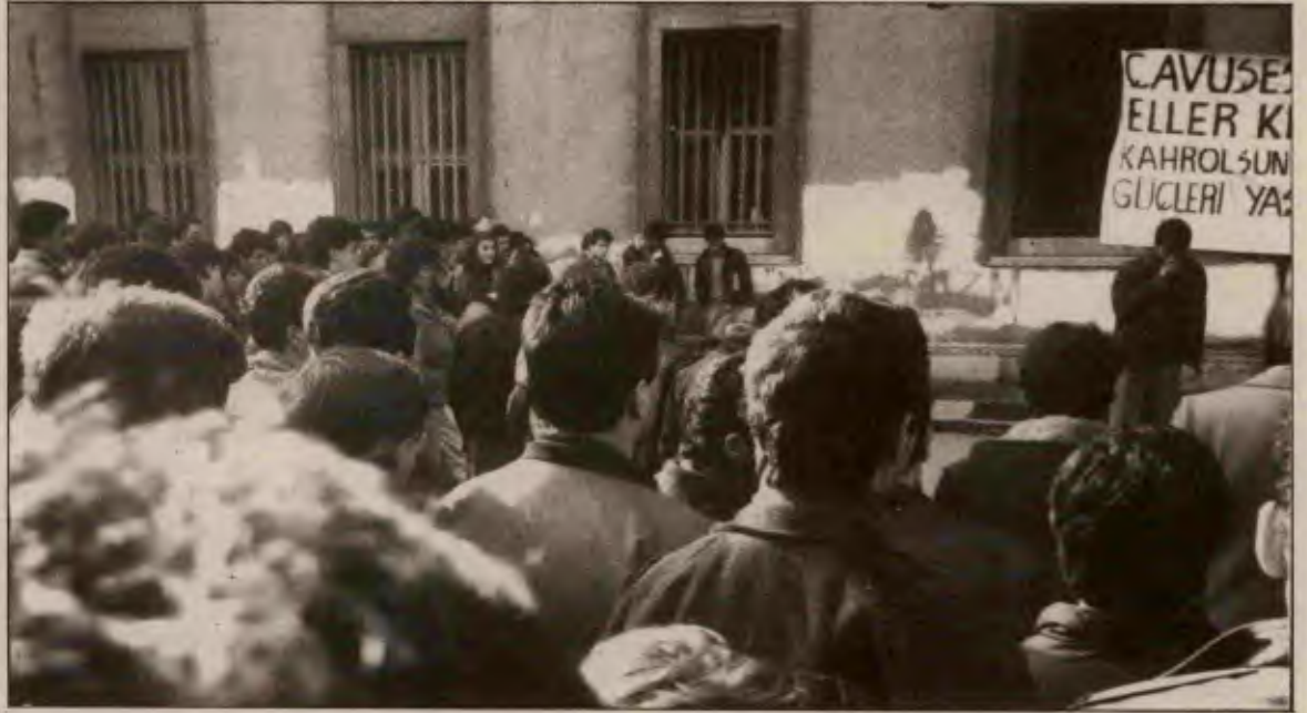
Romanya karşı-devrimi, öğrenci gençlik hareketi içinde devrimci-reformcu ayrımının yansıdığı bir tartışma odağı oldu. Başta Dev-Genç ve biz olmak üzere devrimciler, doğru tutum aldılar.

demokratların öncülüğünde irili ufaklı bir sürü oportünist, revizyonist, neredeyse Romanya'daki karşı-devrime bağış toplayacaklardı.