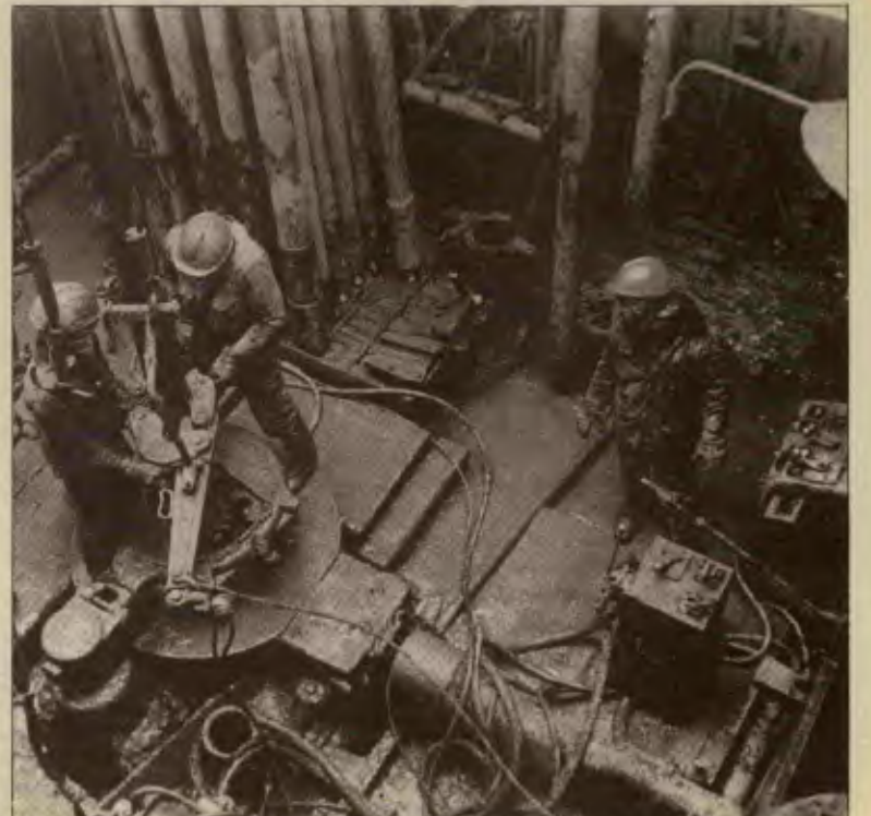
Gorbaçov'un hain planlarına karşı işçi sınıfının tek silahı gerçek bir komünist partinin tunç bileğidir.

Romanya karşı-devrimi ve Azerbaycan'a yapılan askeri müdahale, bu "demir bileğin"(!) ne menem birşey olduğunun yansıması oluyor. İşçi sınıfının bu gelişmelere karşı, tek bir silahlı olabilir: Marksizm-Leninizmle silahlanmış, aktif yığın demokrasisini hedeflemiş gerçek bir komünist partinin tunç bileği!